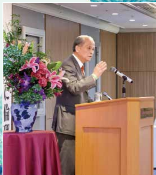
(写真:島田 実 相談役)

“組織が自走する姿”の疑似体験となりました。笑いの奥に、人を信じるリーダーシップが光る講演会となりました。